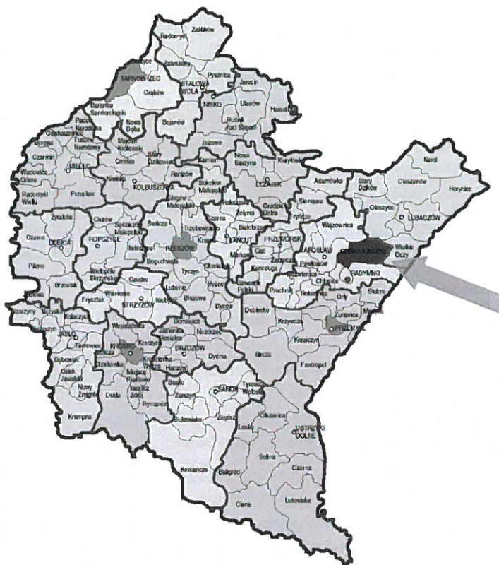
Rysunek 1 Lokalizacja Gminy Laszki w woj. Podkarpackim