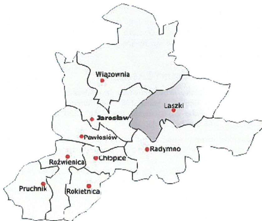
Rysunek 2 Usytuowanie Gminy Laszki w Powiecie Jarosławskim

Gmina Laszki liczy 6993 mieszkańców (wg GUS - stan na dzień 31 grudnia 2016 r.). Gmina należy do gmin rolniczych. Na terenie Gminy funkcjonują dwa Rolnicze Zespoły Spółdzielcze oraz jedna Rolnicza Spółdzielnia Produkcyjna a także 1300 gospodarstw indywidualnych (dane własne UG Laszki). Średnia wielkość gospodarstw wynosi 5,60 ha.