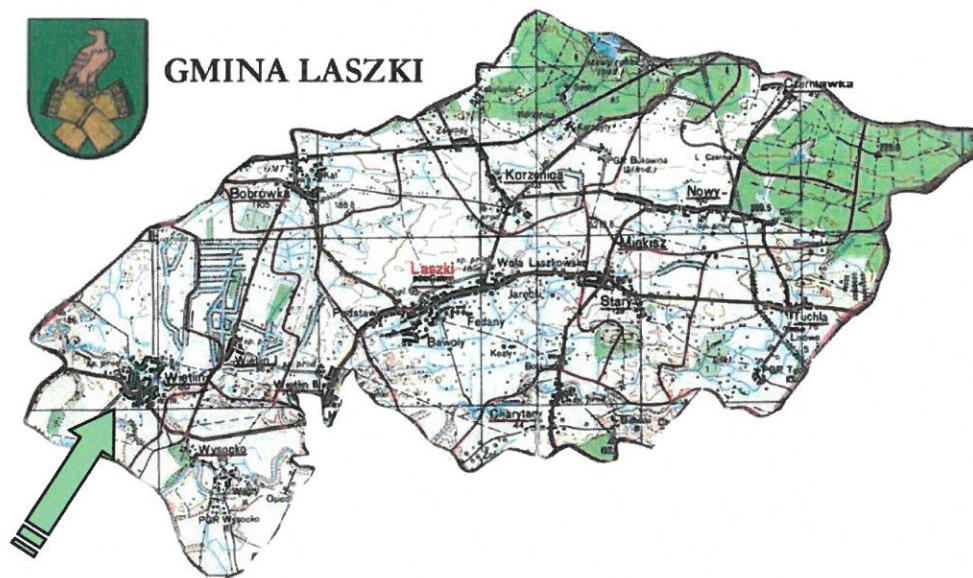
Rysunek 3 Usytuowanie miejscowości Wietlin w Gminie Laszki

Sołectwo Wietlin zajmuje powierzchnię 13,6 km 2 , zamieszkuje ją 814 osób. Teren równinny, ok. 172-185 m. n.p.m. Gleby w sołectwie należą do gleb dobrych i bardzo dobrych – łąy, mady. Mienie wiejskie zajmuje powierzchnię 99 ha. Tereny przy rzece Szkło są terenami zasobnymi w żwir i piasek. Przy rzece zlokalizowane są stawy po wyrobiskach żwiru.